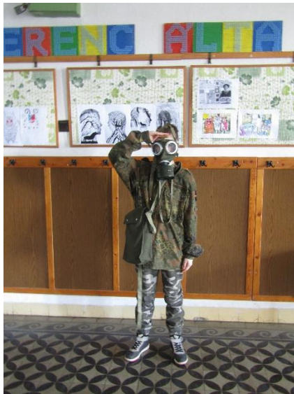
4. ábra Farsangi jelmezben a folyosón a Covid idején

A mosdók állapotának fenntartásáért sokat teszünk, de az idő azért nyomokat hagy itt is. (Különösen, hogy tanulóink télen melegedőként, nyáron hűsítőként és minden időszakban klubhelységnek használják. Az ügyeletes állandó feladata kiküldeni a gyerekeket.) Az egészségügyi festés minden évben ráfér. A fotocellás öblítők, zárok cseréje nehezen megoldható.