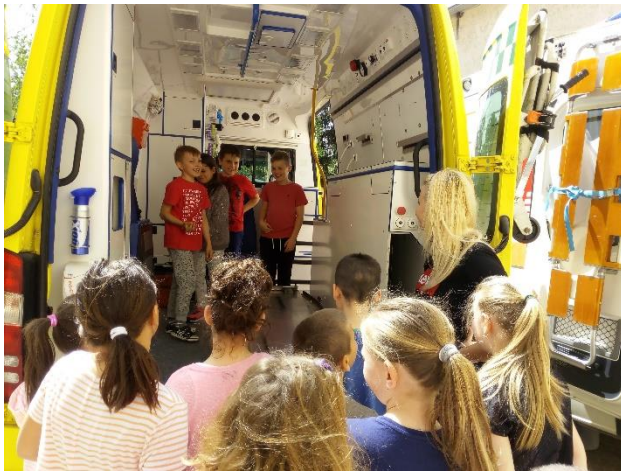
15. ábra Mentősök bemutatója

Már többször említettem az integrációval kapcsolatos elveimet. Az is szóba került, hogy saját gyógypedagógusunk végzi a rehabilitációt, rehabilitációt. Jeleztem már érintett tanulóink létszámát is. A helyi rendszer működik, kolléganőm „képben van” minden tanulóval kapcsolatban. Kis fejlesztő szobánk jól szolgálja az előírt feladatokat. Tervem szerint azonban hamarosan tágasabb terembe