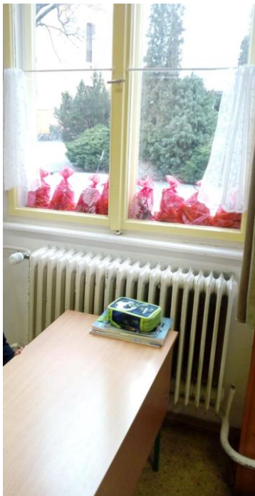
12. ábra Az SZM által biztosított Mikulás csomagok az ablakban

Örülök annak, hogy a szülők nagyobbik részével igazán jó, segítőkész a kapcsolat. Sokat köszönhetünk nekik (projekt napok, tanórán kívüli tevékenységek, karbantartási munkák, stb.)