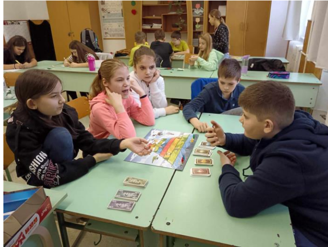
10. ábra Integráció: jobb oldalt két "papíros gyerek"