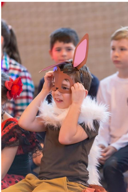
8. ábra Egy tanuló a 143-ból

Iskolánkban jelenleg 141 tanuló tanul. (Ez 2014-16-ot idézi). 2019-ben még 123-an voltunk. Majd egy osztálynyival nőtt a létszám. Ennek egyik oka, hogy több gyermek született Süttőn, másik ok az évfolyamonként 1-2 tanuló, aki más településről érkezik, a harmadik, hogy nem jellemző a 4. és a 6. évfolyam elvándorlása, végül pedig a magatartási és más problémák közben tartása (ezáltal csökkentése). De, hogy ez így van abban a vezetőségnek és a tantestületnek nagyon sok munkája fekszik.