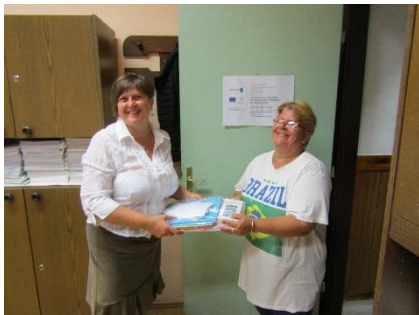
11. ábra HH szülő átveszi a füzetsomagot

A HH (1 fő) besorolás az étkezés megoldásával együtt az önkormányzat hatáskörébe tartozik. A községi gyámügyi ügyintézővel jó a munkakapcsolatunk.