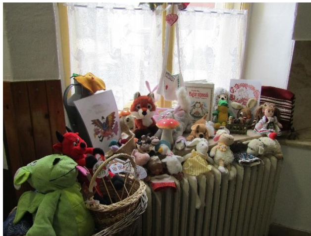
7. ábra A magyar népmese napja

együttműködés, stb. Ezek az attitűdök pedig nem a falakból sugároznak, hanem az emberekből. Az utóbbi években azt tapasztaltam, hogy ez is olyan terület, ahol egy igazgatónak egyre nagyobb a felelőssége és egyre nagyobb a feladat „volumene” is. A mélyreható társadalmi változások követése, megértése, irányítása és az ezekhez való alkalmazkodás egy mai iskolai vezető csodaszere. Egészen másként kell igazgatni az intézményt ma, mint, akár öt, akár tizenöt esztendővel ezelőtt. Mondhatom ezt bátran, mert megéltem ezt a folyamatot. Az intézményvezető számára a megújulás, alkalmazkodás képessége létkérdés.