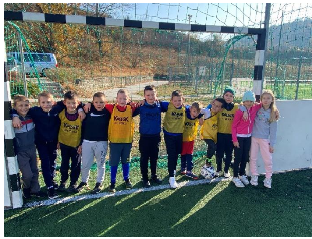
20. ábra Intézményi Bozsik torna csapata

Ez egy folyamatos feladat. Különösen egy olyan intézményben, ahol egy biológia, vagy kémia tantárgy mindössze 3-3 órát ad a kolléga kötelező óráihoz. Itt érdemes lenne az áttanítás rendszerét, vagy az óraadást átalakítani. Természetesen a pályázatoknál, továbbképzések tervezésénél fontos az igazgató előrelátása. Nagyon nehéz feladat.