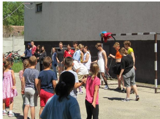
6. ábra Össztánc a "bolond ballagás" végén

Az iskola hátsó udvarán található kézilabdapálya a szabadtéri foglalkozások közkedvelt helyszíne. A szünetekben, napközis szabadidőben szinte mindig itt tartózkodnak a gyerekek. Az aszfalt sajnos megsüllyedt a gödrök egyre nagyobbak. Szükség lenne az udvari világító oszlopok elektromos felújítására. Festeni, javítani kell a labdafogó hálókat, kapukat.