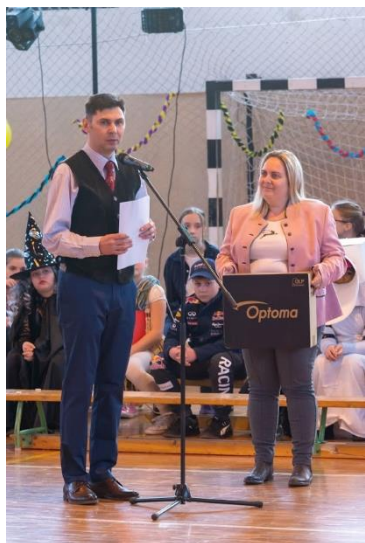
16. ábra Kivetítőt kaptunk a Süttöi Német Nemzetiségi Önkormányzattól

Erőforrásaink közé tartoznak a kapcsolataink. Egy-egy feladat egyszerűbben, hatékonyabban megoldható kapcsolatok felhasználásával. Ezen a területen folyamatosan fejlesztem kell magam. Sajnos hamarabb nekilátok egy feladatnak, mint hogy bevonjam a kapcsolati rendszert. Ezen változtatok és továbbra is változtatnom kell.