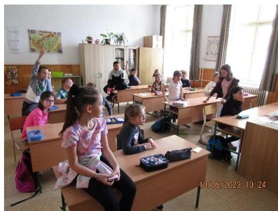
2. ábra Tantermeink