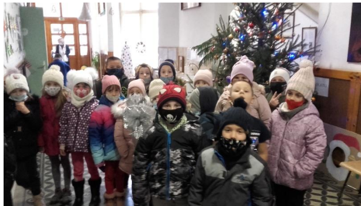
17. ábra Ez egy más karácsony volt

Légy becsületes, hogy szándékosan soha senkit gyalázzal ne illess.”