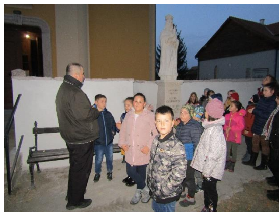
14. ábra Szent Lipót nap a helyi pélbánossal

Új jelenség, hogy a fejlesztésért a gyerekek