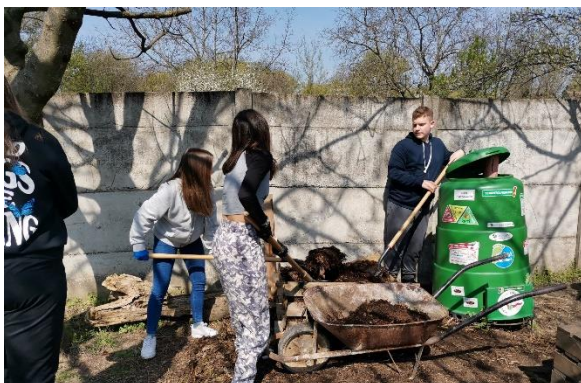
19. ábra A komposzt megy az iskolakertbe

A klímaválság közepén nem mehetünk el e kérdés mellett. Energiatakarékosság, környezetvédelem a kulcsszavak. Azt szeretném elérni, hogy a gyerekek által sokszor elszavalt elméletből gyakorlat váljon.