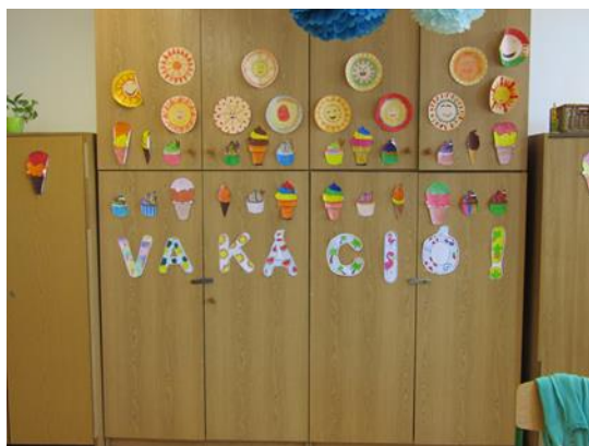
3. ábra Tantermeink 2

Az osztálytermek mindegyike 20-30 fő befogadóképességű. A jelenlegi gyereklétszámok mellett így kényelmes, tágas helyek gyermekeink számára. Az állandó, tervezhető renoválási munkákat nagyon fontosnak tartom. Az elmúlt években részleges meszelések javították az állapotokat, de alapos felújítás sajnos nem volt. Szükség lenne az épület fa nyílászáróinak javítására és a mázolására is, (legjobb lenne ezeket is –a felső szinthez hasonlóan– műanyagokra cserélni.) Az elkövetkező ciklusban szeretném, ha ez megvalósulna.