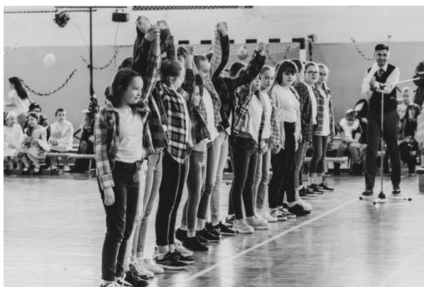
1. ábra Az igazgató szerepe

Az idézet attól a pszichológustól származik, aki az én korosztályom számára A PSZICHOLÓGUS volt. Amit mondott az tananyaggá válto pedagógus képzésben Hangzatos az idézet, de valódi értelmét csak mostanában kezdem megérteni. Így 26 év pedagógus pályával és 3 és fél igazgatói ciklussal a hátam mögött kezd derengeni, hogy mit jelen, amikor élvezet és mit jelent, amikor mindennapi nyűg a munka; mit jelent az egyetlen jó válasz, és milyen jó, amikor a tanuló önállóan gondolkodik. Ennyi gyakorlat kellett ahhoz, hogy megértsem mihez kell hozzásegítenem a tanulókat és a tanárokat is intézményvezetőként. Az igazgatói pálya nem könnyű, ráadásul kicsit magányos is. A fenti gondolatok tartalma az a tűz, ami nem úgy lobog, mint az első öt évben. egészen másként: csendesebben, kevesebb ropogással, de úgy érzem, most tud igazán melegíteni, most van a legnagyobb ereje. Már nem motivál a pozíció, (tudom, mivel jár) a nagyszerű szervező szerepe is megvolt, a világmegváltás szándéka sem az első már. Akkor mi az, amiért ezt a pályázatot írom? Ott van az idézetben: mesterré válni és élvezni a mesterré válás folyamatát, és ezáltal lehetőséget biztosítani gyerekeknek és felnőttek egyaránt, hogy ők is fejlődhessenek. Hosszú gondolkodás után ezekkel a „felütésekkel” indulok neki pályázatom elkészítésének.