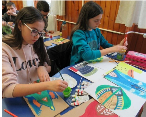
9. ábra Pályamunka készül

Állandó és elcsépeelt gondolat, hogy a csoportalakítás, szocializáció, empátia, tolerancia kialakulásában elsődleges szerep hárul az osztályfőnökre . Elcsépeelt, de igaz. A megfelelő személy kiválasztása elsődleges feladat egy igazgató számára. (személyzeti politika) Ezt az egyik legfontosabb feladatombnak tartom. Bár az utóbbi időben nem népszerű az osztályfőnöki megbízás, mert: