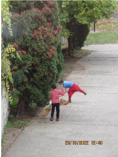
18. ábra A munka is lehet játék

Ebben azt hittem öt éve, hogy élen jártunk az Arizóna programmal és a szakmai napok megszervezésével. Sokat tanultam az óta. Ma már tudom, hogy itt állandóan a „toppon” kell lenni. A mediáció, resztoratív, kooperatív technikák bevonásának szükségét érzem.